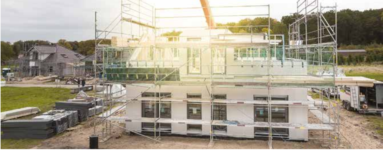
ZEITERSPARNIS: Die zügige Montage vorgefertigter Bauteile verringert die Bauzeit deutlich